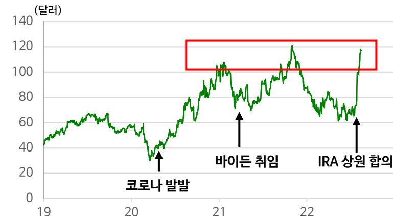
도표2. 퍼스트솔라(FSLR) : 이미 2020~21년 고점 부근까지 상승

중국은 10월 당대회, 미국은 11월 중간선거를 앞두고 계속 정책을 내놓을 분위기라 자율 반등은 좀 더 이어질 것 같다. 그러나 경기 전반의 회복력과 중국 부동산 시장에 대해 면밀히 관찰이 필요해 보인다. 이번 주는 한국 정부도 250만호 공급 대책을 발표할 예정이다.